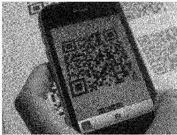
Un QR Code

Immobili: segnali di ripresa Compravendite in crescita Treviglio: operai contro la Cisl Lancio di uova verso la sede In un anno l'inflazione sale del 2% Bergamo tra le più «care» al Nord Unicredit, il neo amministratore è stato direttore di filiale a Seriate Anitrust: accordo Governo-gestori impedisce il calo del prezzo della benzina